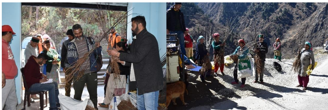
Figure 10. Distribution of plants against the dead plants (mortality) to the Wadi farmers of Bari and Tranda Panchayats, District Kinnaur.

In planting season of the year 2021-22 under the Project, total 20250 apple plants of high coloring strain spur varieties were distributed to 124 farmers of the Project area (Bari and Tranda gram panchayats) which were planted by the farmers. During the survey of Wadis, it was observed that out of 20250 apple plants planted, 16350 plants were survived, whereas 3900 plants (19%) were found dead. Therefore, as replacement of these dead plants total 3900 plants of apple were again distributed to 124 farmers in the month of February 2023.