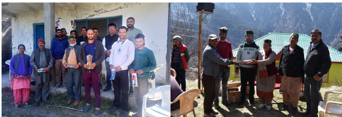
Figure 14. Distribution of horticulture tools to the Wadi farmers.

For Wadi maintenance, there is a provision for the distribution of horticulture tools so that the farmers could train and prune their apple plants every year. Under this provision, during the financial year 2022-23, horticulture tools (high standard) like pruning shear and pruning saw was provided to all 244 Wadi farmers of the project area. Before the distribution of these tools, trainings were also provided to the farmers about the use of these tools.