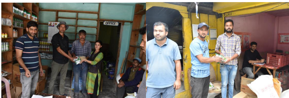
Figure 11. Distribution of Inputs for raising Inter Crop to the Wadi farmers of Bari and Tranda Panchayats, District Kinnaur.

In young fruit orchards, growing economic crops in interspaces of the fruit trees during first few years is referred as intercropping. It enables farmers to utilize not only the vacant space efficiently but also enable them to earn additional income from the same piece of land. The low height inter crops are ideal companion of perennial large fruit trees. Keeping in view the importance of intercropping in young fruit orchards, the wadi farmers of the project were encouraged to go for intercrop. For doing so, during the year 2022-23 quality seeds of 270 kg Kaju Rajmash, 32.4 kg Palak, 31 kg China Sarson, 1.24 kg Yellow Squash and 1.24 kg of Beet Root seeds were distributed to 124 Wadi farmers of the Project area (Tranda and Bari) on 2 nd and 3 rd June 2022.