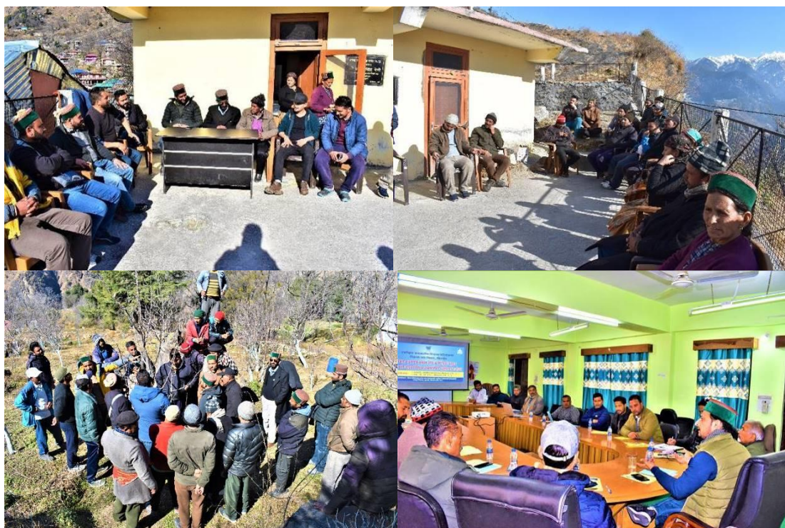
Figure 1. Trainings of BODs, CEO and members of FPO – 15/20 Green Valley Fruit & Vegetable Growers Marketing and Processing Cooperative Society Ltd. at different venues.

and second on 4 th February 2023 were organised. Under both the trainings the topics like concept & need of FPO, role & responsibilities of BODs, CEO & members of FPO, managerial issues of FPO, financial management in FPO, input supply management, business planning and marketing related issues were discussed along with the training of member farmers on training and pruning of apple fruit plants/trees and other issues of apple orchards management.