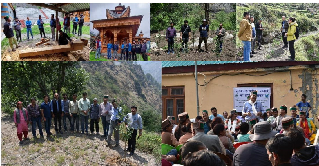
Figure 16. Monitoring of Wadis (orchards) by the CGM and other Officers of NABARD.

The project activities are being regularly monitored by District Development Manager (DDM), NABARD, District Kinnaur and Sr. Manger (CSR), NJHPS (SJVN), Jhakri, District Shimla. The officers of NABARD, HP Regional Office, Shimla have also conducted monitoring of the Project in June 2022 and March 2023. The Chief General Manager, NABARD, HP Regional Office, Shimla also visited the Project area (gram panchayat Tranda and Bari) on 25 th June 2022 along with other officers (DDMs, GM, DGM, AGMs & AMs). During this visit the CGM NABARD while monitoring the performance of wadi establishment also interacted with the Wadi farmers and Landless beneficiaries of the Project.