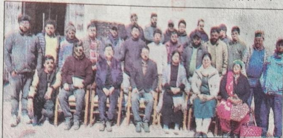
शिमला: क्षमतावर्धन कार्यक्रम के दौरान संयुक्त चित्र में किसान उत्पादन संगठन के सदस्य।