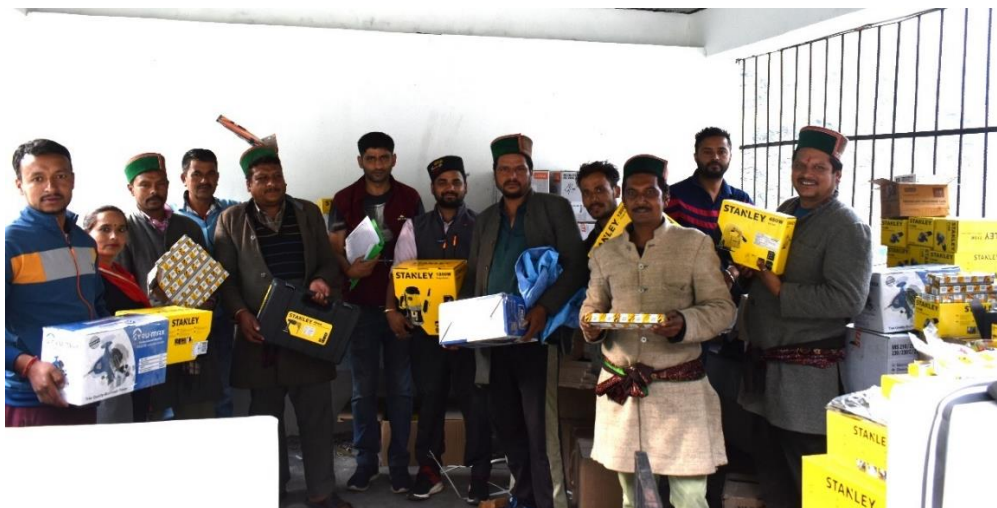
Figure 15. Distribution of carpentry and wood carving tools to Landless beneficiaries of the Project.