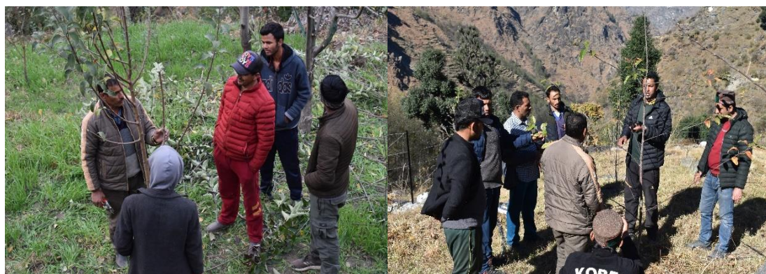
Figure 5. Skill development trainings in training and pruning of apple plants.

Total ten skill development trainings in training and pruning of apple plants were organized on 15 th , 23 rd , 24 th , 25 th & 30 th November at Kafour, Nigulsari, Vikasnagar, Chaura & Bari, on 7 th , 9 th & 10 th December 2022 at Chhonda, Kafour & Bari, on 20 th January 2023 at Nanspo and on 6 th February 2023 at village Bari. During these trainings the resource persons from Horticulture Department were there with the project staff to train the Wadi farmers. The Wadi farmers were informed that the training and pruning in apple plants should be done in dormancy period from November to February months during winter. However, keeping in view the vegetative growth in plants the summer pruning can be done in August month.