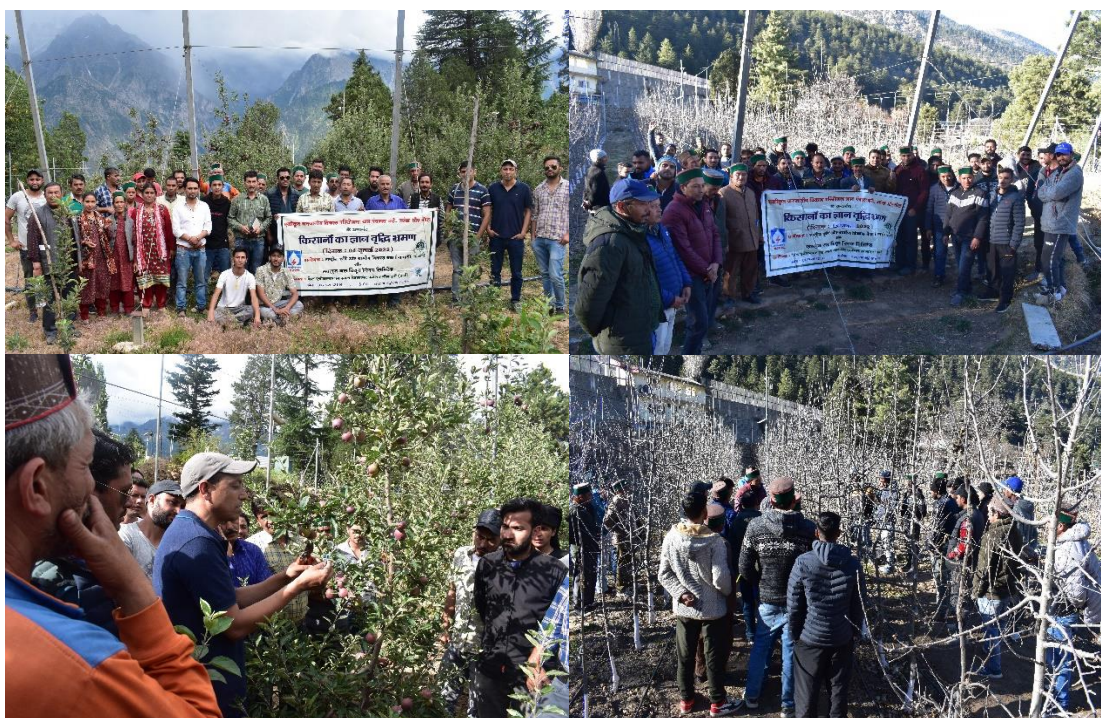
Figure 6. Exposure visits held at different demonstration sites of RHR&TS and KVK at Sharbo, district Kinnaur, Himachal Pradesh.

Total two exposure visits (1 st on 4 th July & 2 nd on 15 th December 2022) were organized to expose the Wadi farmers with the best practices of orchard development & management, post-harvest management & processing technology of apple fruits being done by the scientists at Regional Horticultural Research & Training Station (RHR&TS) and Krishi Vigyan Kendra (KVK) at Sharbo, District Kinnaur, Himachal Pradesh. Exposure visits were conducted to convince the farmers and provide them an opportunity of seeing and believing the results of new practices, demonstration of skill and to give them an idea regarding the suitability and application of these things in their own orchards. The farmers were also taken to the demonstration sites of the RHR&TS and KVK.