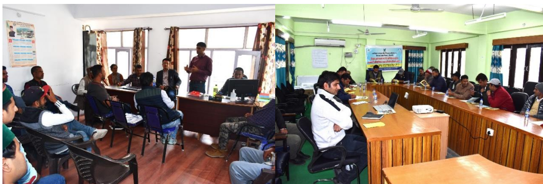
Figure 7. Capacity building and leadership trainings to BODs of FPOs, VPCs & PTDC.

Under the TDF Project two trainings (1 st on 13 th May 2022 and 2 nd on 19 th November 2022) of BODs of Farmer Producer Organization (FPO), Village Planning Committees (VPCs) and Project Level Tribal Development Committee (PTDC) were organized at Bhabanagar. In these training programmes the participants were made aware about concept and need of FPO, VPCs and PTDC. They were also made aware about basic activities of FPO like - aggregation & marketing of produce, supply of inputs, making provision of services to member farmers, etc. During these trainings the BODs and CEO were also informed about their roles and responsibilities. How to set agenda items and how to conduct annual general meeting, special general meeting and board meeting was also informed to the CEO and BODs of FPO, VPCs and PTDC. The procedure of preparing different licenses to purchase and sale of agri-horticulture inputs were also informed. The discussion on preparation of business development plan of FPO was also held in these training programmes. The basics of financial management, accounting and funding arrangement in FPO were also taught. The discussion on management of orchards & quality production of apple fruit and marketing of apple were also held in these trainings.