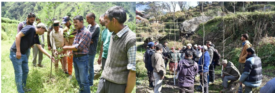
Figure 8. Scientists of KVK Sharbo, District Kinnaur giving on the spot technical advice to the Wadi farmers of village Chhonda and village Kafour, District Kinnaur.

schedule, pollination, training & pruning, soil testing, insect & pest management (root rot, collar rot, etc.).