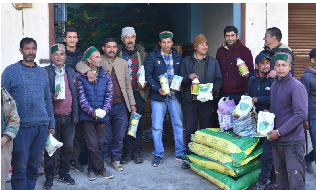
Figure 13. Distribution of inputs of plant (apple) protection material to the Wadi farmers of Bari and Tranda Panchayats, District Kinnaur.

To protect the apple fruit plants from insect and pest attacks a provision for the distribution of plant protection material on 50% contribution basis has been kept in the project. Thus under this provision 20.7 kg Bavistin (fungicide) and 488 L Trichoderma was distributed to 244 Wadi farmers of Bari and Tranda Gram Panchayats on 13 th , 14 th & 15 th November 2022.