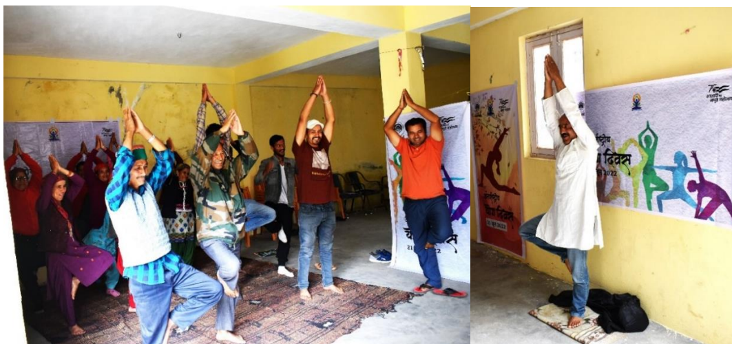
Figure 21. Farmers of Gram Panchayat Chaura, District Kinnaur celebrating International Yoga Day.

In collaboration with NABARD funding support the International Yoga Day was celebrated on 21 st June, 2022 at village Chaura, District Kinnaur, Himachal Pradesh. Total 30 beneficiaries of the TDF Project area have actively participated in this event.