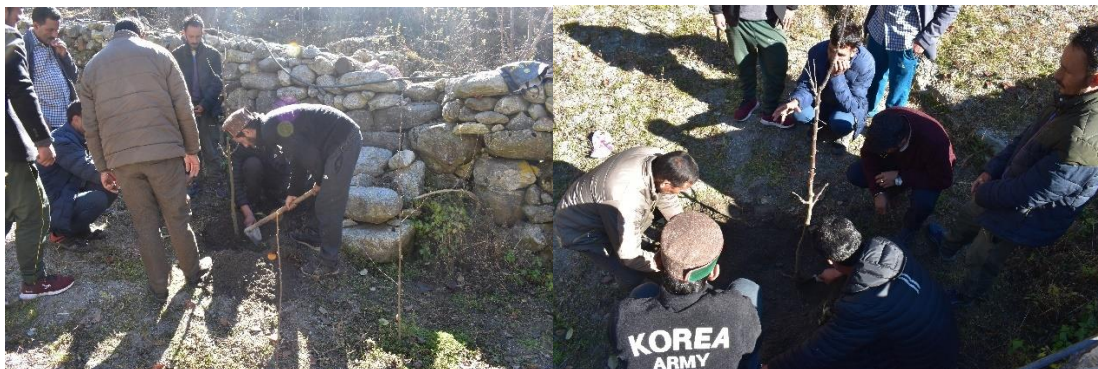
Figure 4. Skill development trainings in preparation of basin, manure & fertilizers application in apple plants being given to the Wadi farmers of Village Vikasnagar.

with MOP and SSP. The urea should be applied from March month to September month in split doses. It was informed to the Wadi farmers that while applying fertilizers, moisture should be there in the soil. During these trainings the recommended doses of FYM and fertilizers were also communicated to the wadi farmers keeping in view the age of apple plants.