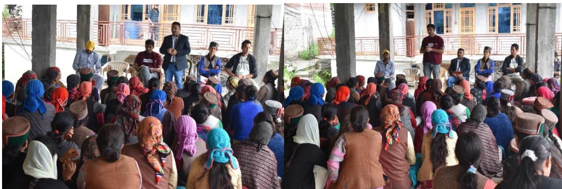
Figure 9. Glimpses of training on woman and child nutrition management held at Village Bari, District Kinnaur.