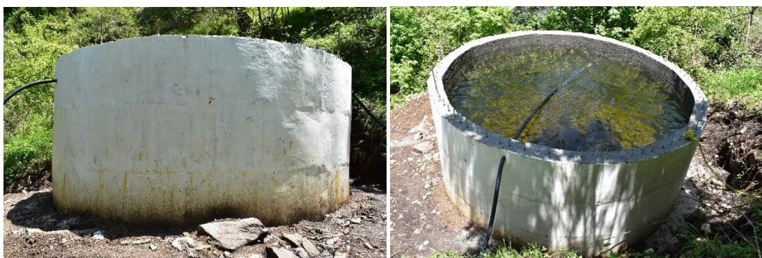
Figure 3. Water storage tanks constructed to irrigate apple orchards at Village Bari, District Kinnaur.

Before the 3 rd years' WRD work, total 2 water storage tanks have been constructed under the WRD irrigation scheme of Khoyo of gram panchayat Bari. Under these irrigation schemes HDPE pipes have also been laid from water source to the tanks.