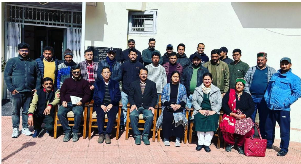
Figure 18. Participants of Capacity Building Training Programme organised for BODs and CEOs of the FPOs at ACSTI, Summer Hill, Shimla.