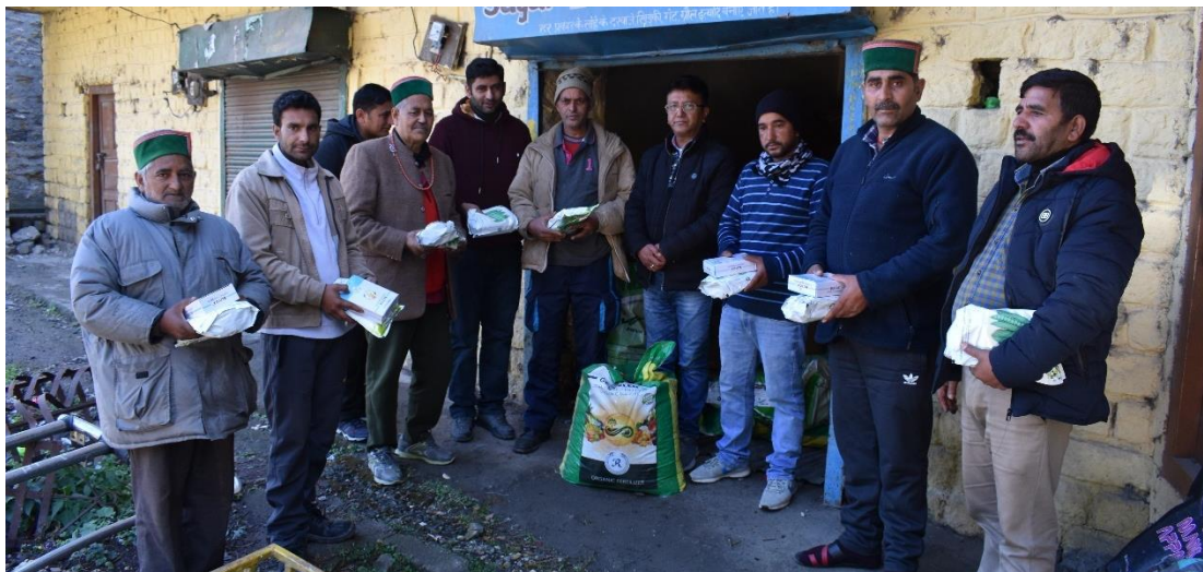
Figure 12. Distribution of inputs for the cultivation of off-session vegetable.