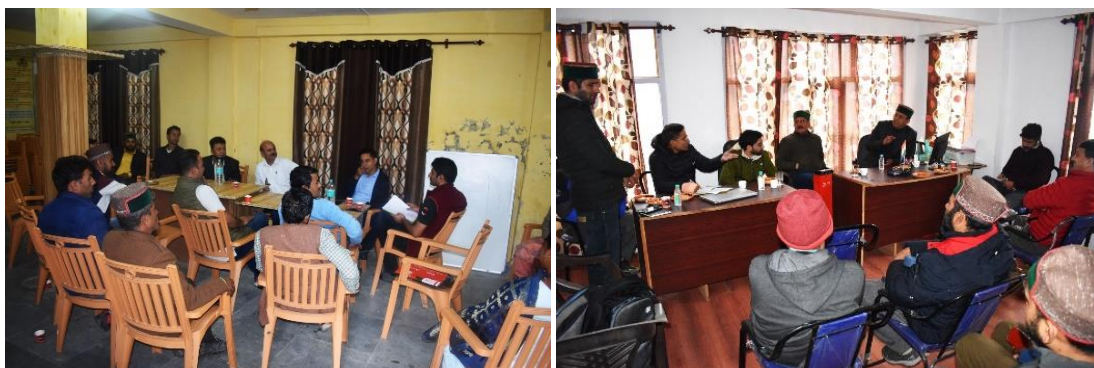
Figure 17. Glimpses of Project Monitoring and Implementation Committee (PMIC) meetings.

Along with field monitoring carried out by the DDM NABARD & SJVN officers, the progress made under the project are being reviewed in PMIC meetings. During the year 2022-2023 two PMIC meetings on 20 th September 2022 and on 20 th January 2023 were held in which the officers from NABARD & SJVN, representatives of PIA and members of PTDC and VPCs were present. In these PMIC meetings future project execution plan was discussed.