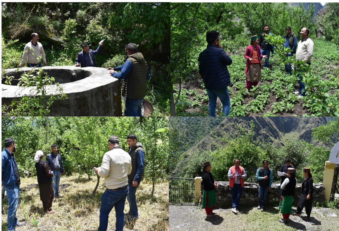
Figure 2. Monitoring of project activities by the GM and DDM NABARD.