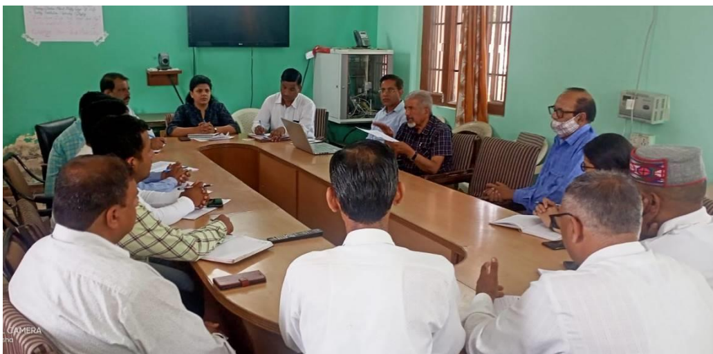
Figure 20. Orientation meetings with Project Director, DRDA, Nahan, BDOs, representatives of PRIs of all the selected Micro-watersheds/Panchayats of Pachhad & Paonta Blocks.

The Paonta Sahib watershed contains 9 micro-watersheds having 3737 ha total geographical area, out of which an area of 3000 ha has been proposed for treatment. On the other hand the Pachhad watershed contains 3 micro-watersheds having 4132 ha total geographical area, out of which an area of 2600 ha has been proposed for treatment.