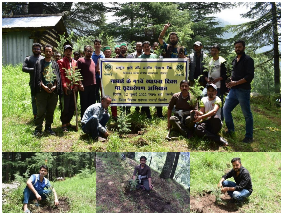
Figure 22. Celebrating Van Mahotsav at Village Bari, District Kinnaur on the occasion of District Level Celebration of 41 st Foundation Day of NABARD.

Every year the NABARD celebrate its Foundation Day on the 12 th July through carrying out various activities. On the advice of District Development Manager (DDM) NABARD, District Kinnaur, HARP has organized Van Mahotsav at Village Bari of District Kinnaur, Himachal Pradesh keeping in view the occasion of District level celebration of 41 st Foundation Day of NABARD. On this occasion 20 Wadi farmers of village Bari and the Project Staff of HARP have planted 200 plants of Devdar ( Cedrus deodara ). The Van Mahotsav was celebrated to raise awareness about the importance of trees and forests in our environment. It was aimed to encourage the farmers of village Bari to actively participate in tree planting initiatives and developing a sense of environmental responsibility and sustainable living.